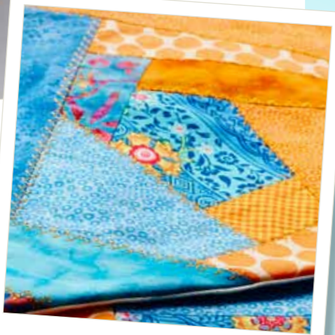
Honderden steken om uit te kiezen!

De automatische draadafsnijder snijdt het garen af en trekt de uiteinden naar de onderkant van uw stof.