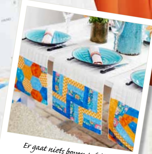
Er gaat niets boven tafellopers met een quilt-look!

Tip: Ontdek hoe u gequilde tafellopers kunt maken op www.busquarnaviking.com